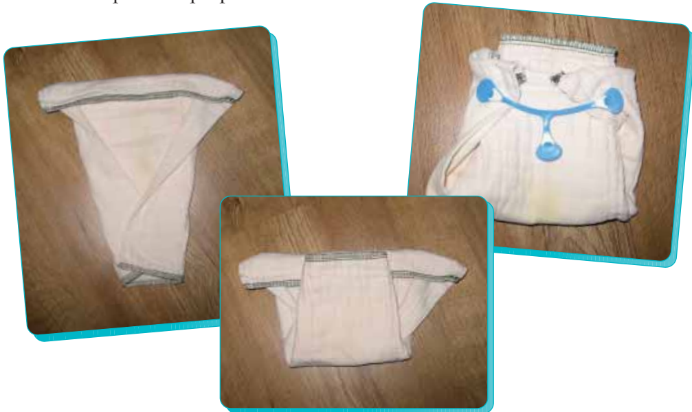
Voilà comme on plie les couches pefold (en anglais, plier avant)